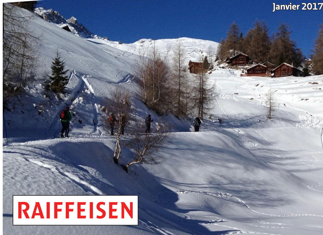
Evolène - La Giette Janvier 2017